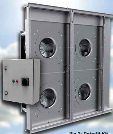
Pic.2: Retrofit Kit