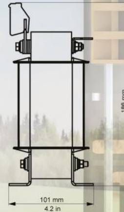
Figure 3: Transformer lateral side