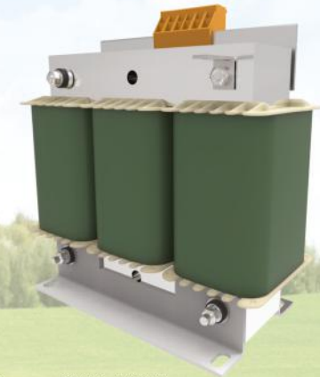
Figure 5: Transformer 600 V / 460 V