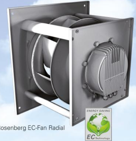
Figure 4: Rosenberg EC-Fan Radial